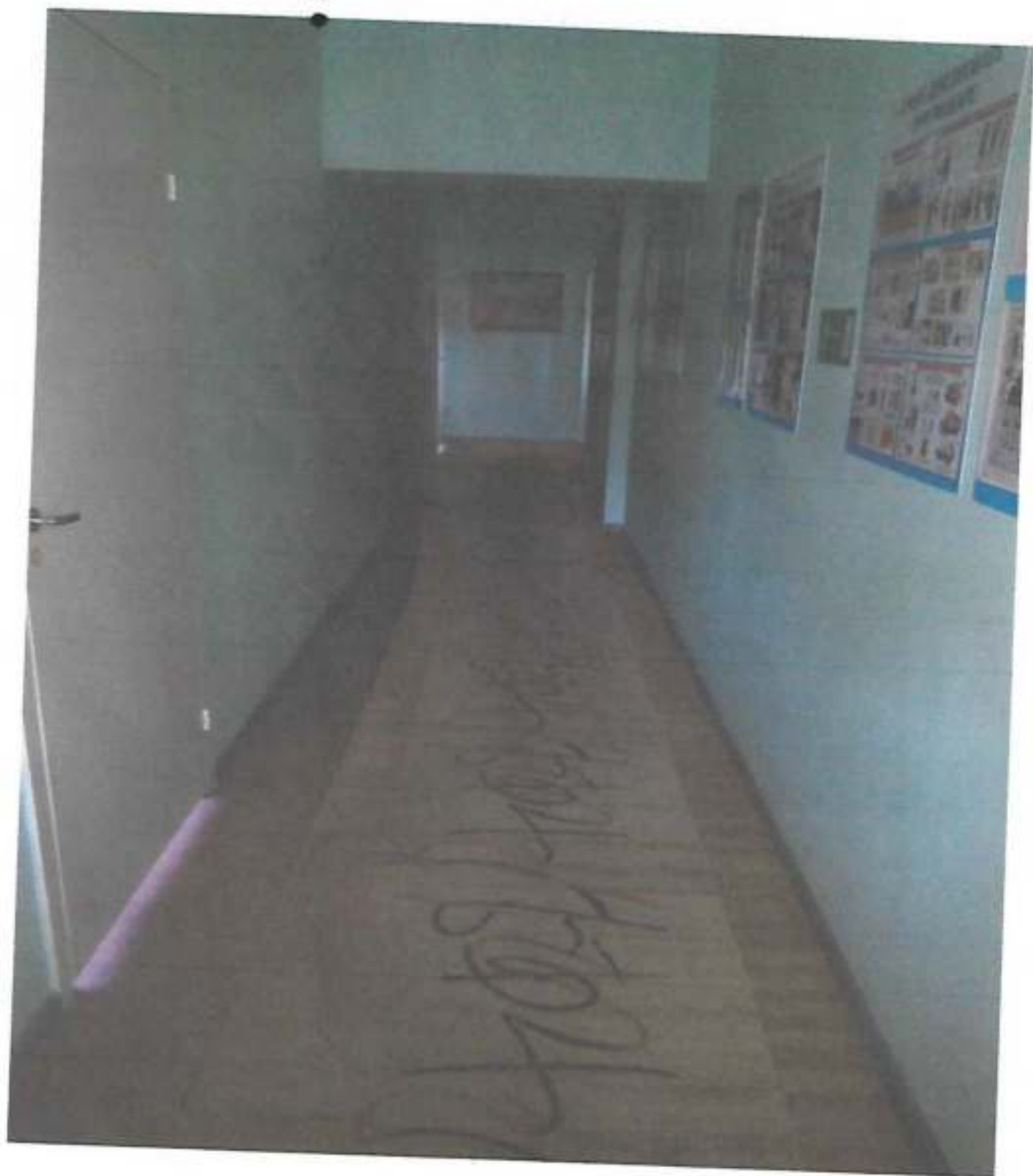
Φοτο № 5