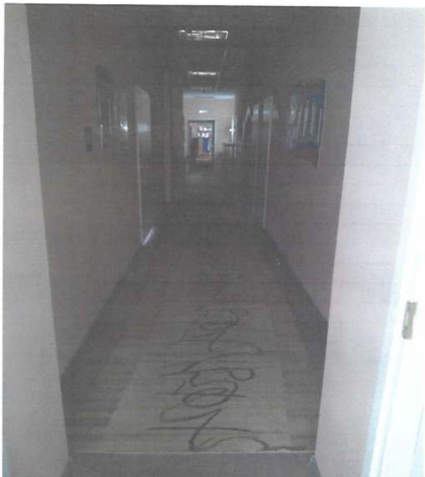
Φοτο Νο 8