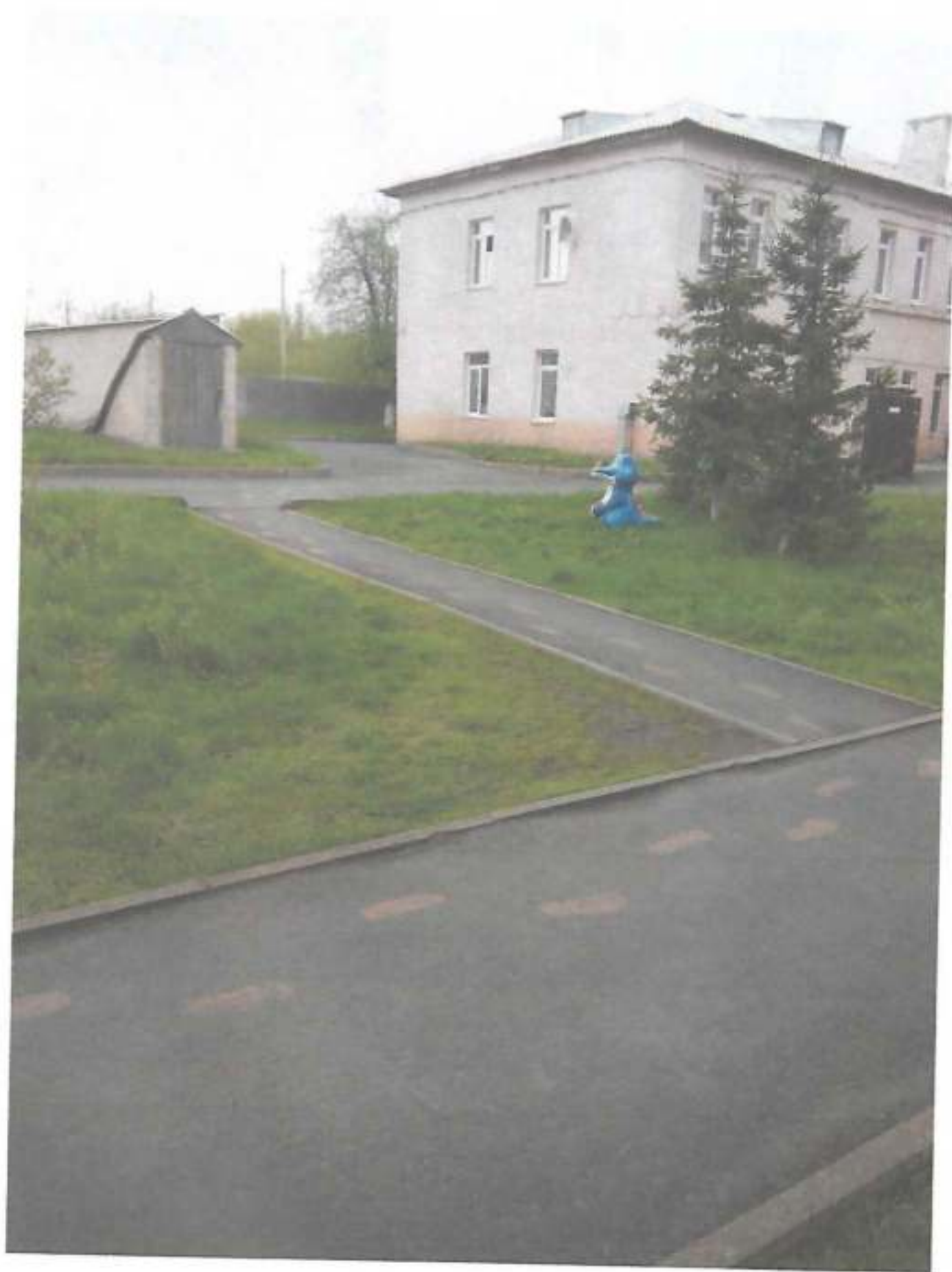
Фото № 10