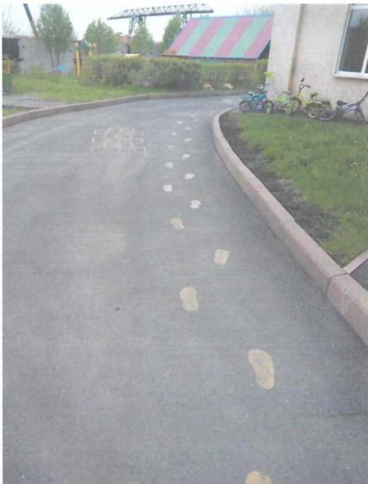
Фото № 13