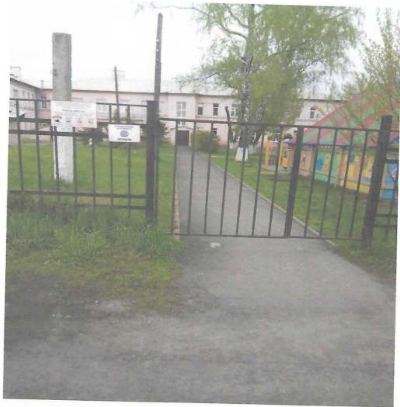
Фото № 9