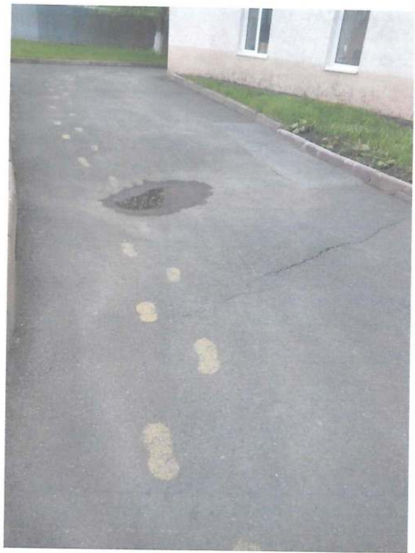
Фото № 11