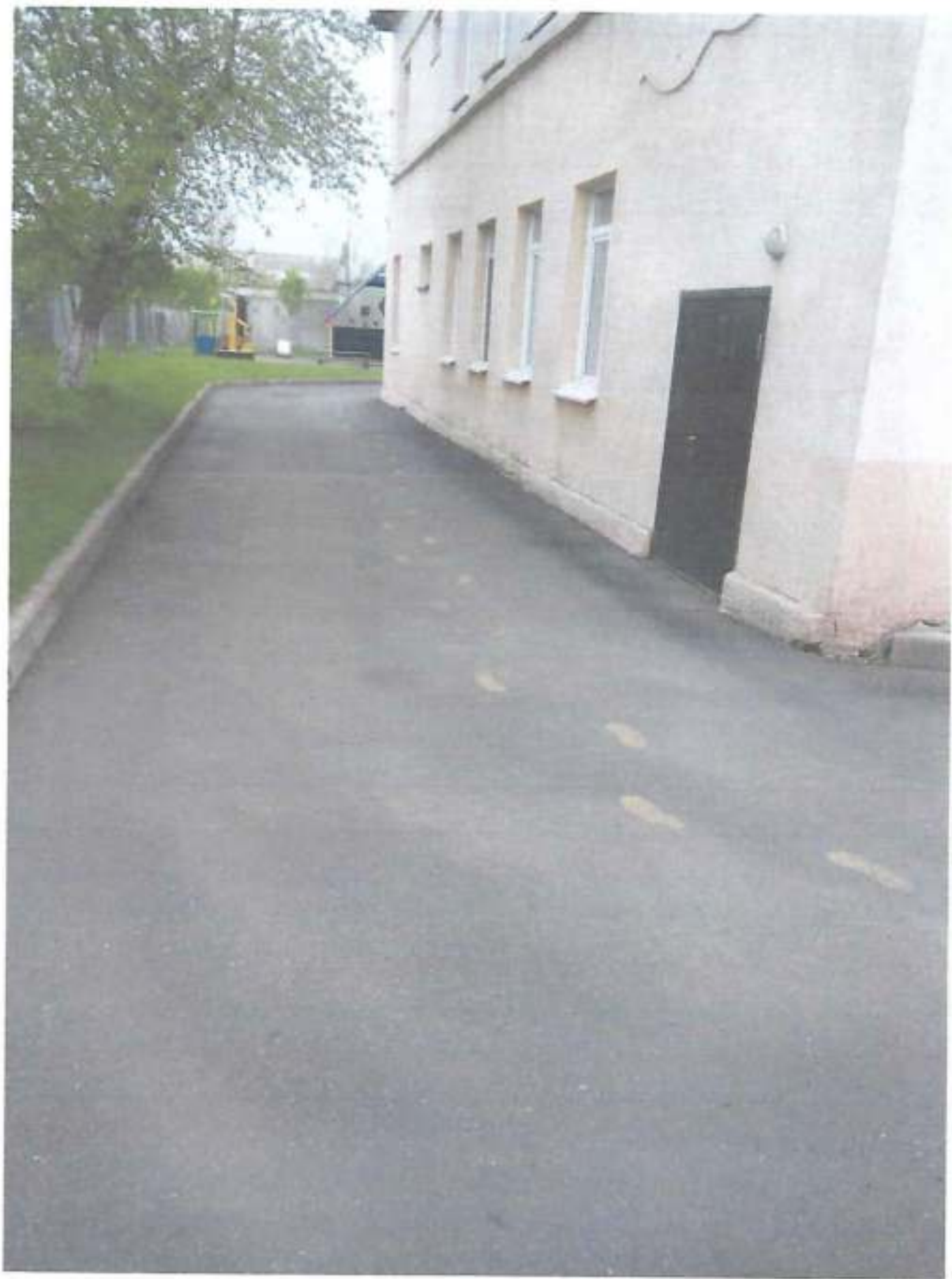
Фото № 12