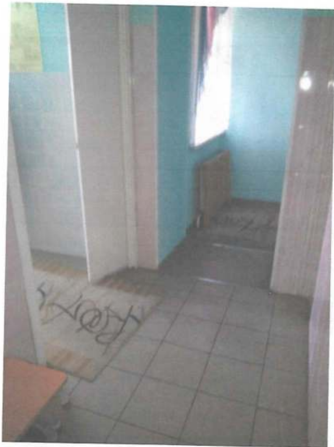
Фото № 6