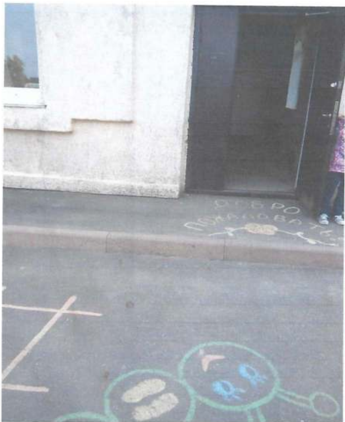
Фото № 14